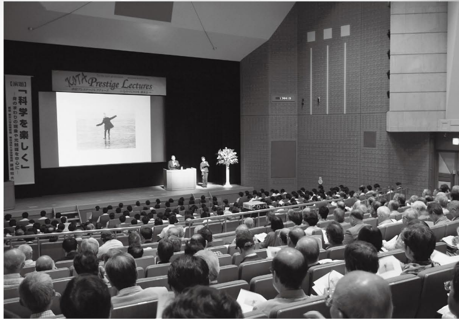
《過去の講演写真です》

幸田プレステージレクチャーズは、世界を震撼させる技術を開発されたトップ技術者や世界経済に大きな影響を与えておられるトップ経営者の皆さまを幸田町にお招きし、自らのご経験をもとに、革新的技術、日本や世界の経済情勢、企業の経営哲学、将来の夢などをお話しいただくことで、近隣地域を含め住民の皆さまや企業従事者の皆さまに広い視野をもって地域や日本の将来を考えていただく機会として開催する講演会です。