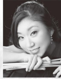
塚越 慎子 ● マリimba Noriko Tsukagoshi

塚越慎子は、パリ国際マリimbaコンクール第1位受賞をはじめ、ベルギー国際マリimbaコンクール、世界マリimbaコンクールなど国内外のコンクールにて数々の賞を受賞して、現在最も注目を集めるマリimba奏者の一人である。