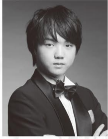
藤田 真央 ● ピアノ Mao Fujita

今年(2019年)6月、チャイコフスキー国際コンクールで第2位を受賞。聴衆から熱狂的に支持され、ネット配信を通じて世界中に注目された。最後のガラ公演では、ゲルギエフ指揮マリンスキー歌劇場管弦楽団と共演。喝采を浴びた。