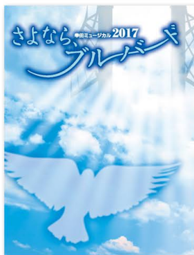
1 さよなら、ブルーバード