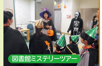
図書館ミステリーツアー