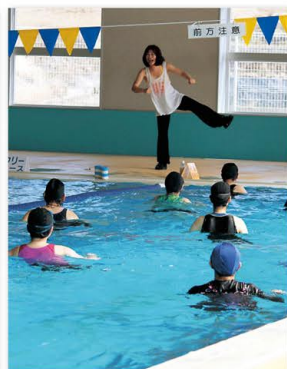
9 アクアビクス無料体験会