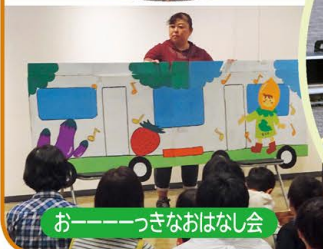
お————つきなおはなし会