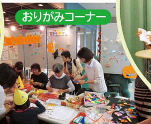
おりがみコーナー