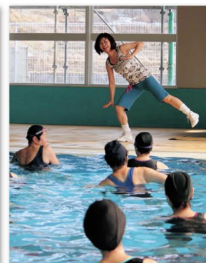
9 アクアビクス無料体験会