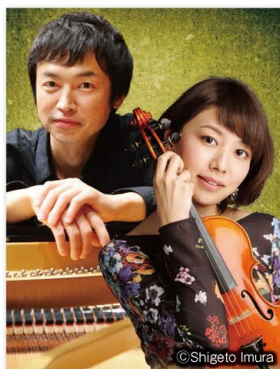
2 加藤昌則meets松田理奈ピアノ&ヴァイオリンコンサート