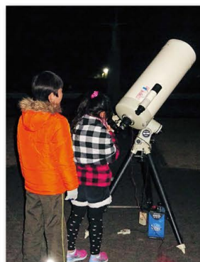
8 ほしぞらウォッチング